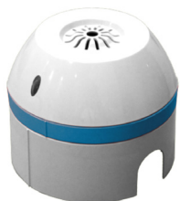
DETECTOR DE NO 2