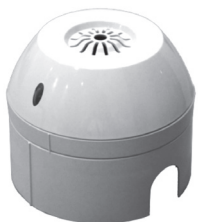
DETECTOR DE CO